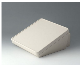
B4422307 PROTEC 220, исп. III АСА+ПК-ФР (UL 94 V-0) белый RAL 9002 220x243x108mm