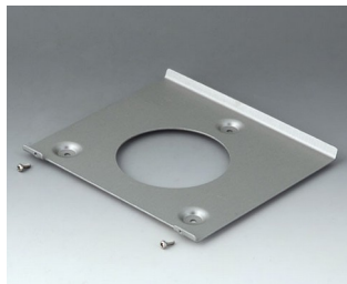
V4522101 Настенный держатель 220 Сталь оцинкованная