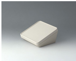
B4414107 PROTEC 140, исп. I АСА+ПК-ФР (UL 94 V-0) белый RAL 9002 140x140x76mm