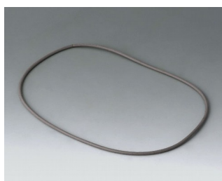
B4514030 Уплотнительная прокладка 140