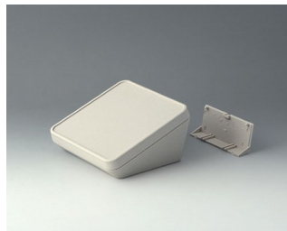
B4414207 PROTEC 140, исп. II АСА+ПК-ФР (UL 94 V-0) белый RAL 9002 140x140x76mm