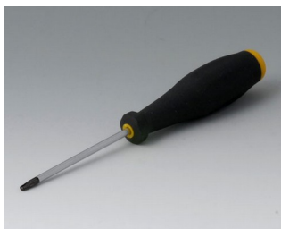
A0399T10 Отвёртка Torx T10

Возможно внесение изменений без предварительного уведомления. © by OKW Gehäusesysteme, Buchen/Germany.