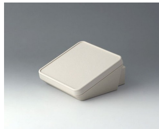
B4414307 PROTEC 140, исп. III АСА+ПК-ФР (UL 94 V-0) белый RAL 9002 140x160x76mm