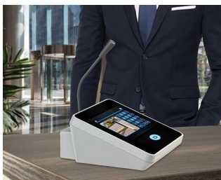
Table microphone / inter phone

Системы наблюдения и контроля доступа, охранные системы Системы сбора данных Сервисные системы зданий, пульта управления Интернет вещей / промышленный интернет вещей "Умное" производство Информационные системы Контрольно-измерительная аппаратура Медицинская техника, охрана здоровья