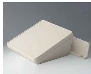
B4422207 PROTEC 220, исп. II АСА+ПК-ФР (UL 94 V-0) белый RAL 9002 220x220x108mm