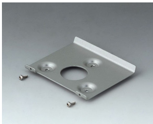
V4514101 Настенный держатель 140 Сталь оцинкованная