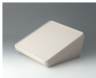
B4422107 PROTEC 220, исп. I АСА+ПК-ФР (UL 94 V-0) белый RAL 9002 220x220x108mm