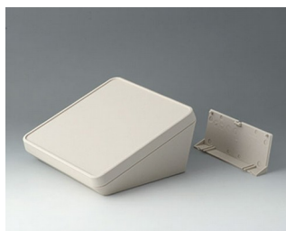
B4418207 PROTEC 180, исп. II АСА+ПК-ФР (UL 94 V-0) белый RAL 9002 180x180x92mm