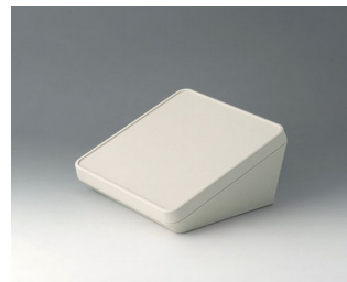
B4418107 PROTEC 180, исп. I АСА+ПК-ФР (UL 94 V-0) белый RAL 9002 180x180x92mm