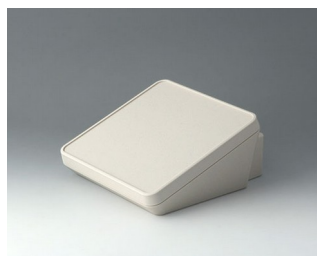
B4418307 PROTEC 180, исп. III АСА+ПК-ФР (UL 94 V-0) белый RAL 9002 180x201x92mm