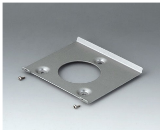
V4518101 Настенный держатель 180 Сталь оцинкованная