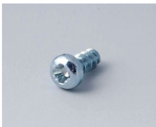
A0305031 Шуруп 2,5 x 6 мм (PZ1)