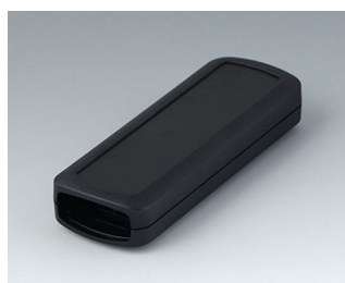
B2824109 CONNECT S ACA+ПК (UL 94 V-0) черный RAL 9005 120x42x22mm