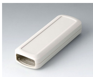
B2824107 CONNECT S ACA+ПК (UL 94 V-0) белый RAL 9002 120x42x22mm