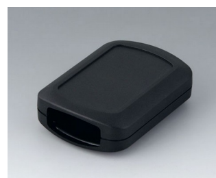
B2832109 CONNECT M ACA+ПК (UL 94 V-0) черный RAL 9005 76x54x22mm