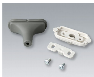
B2911308 Набор для ввода кабеля, 3,4 - 4,2 TPE вулкан