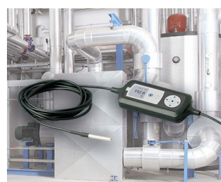
Process monitoring with temperature sensor