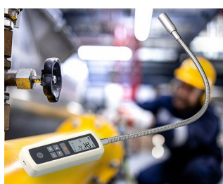
Gas leak detector