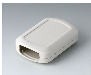
B2832107 CONNECT M ACA+ПК (UL 94 V-0) белый RAL 9002 76x54x22mm