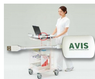
Receiver and data transfer for EMR