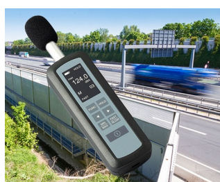
Noise level measurement